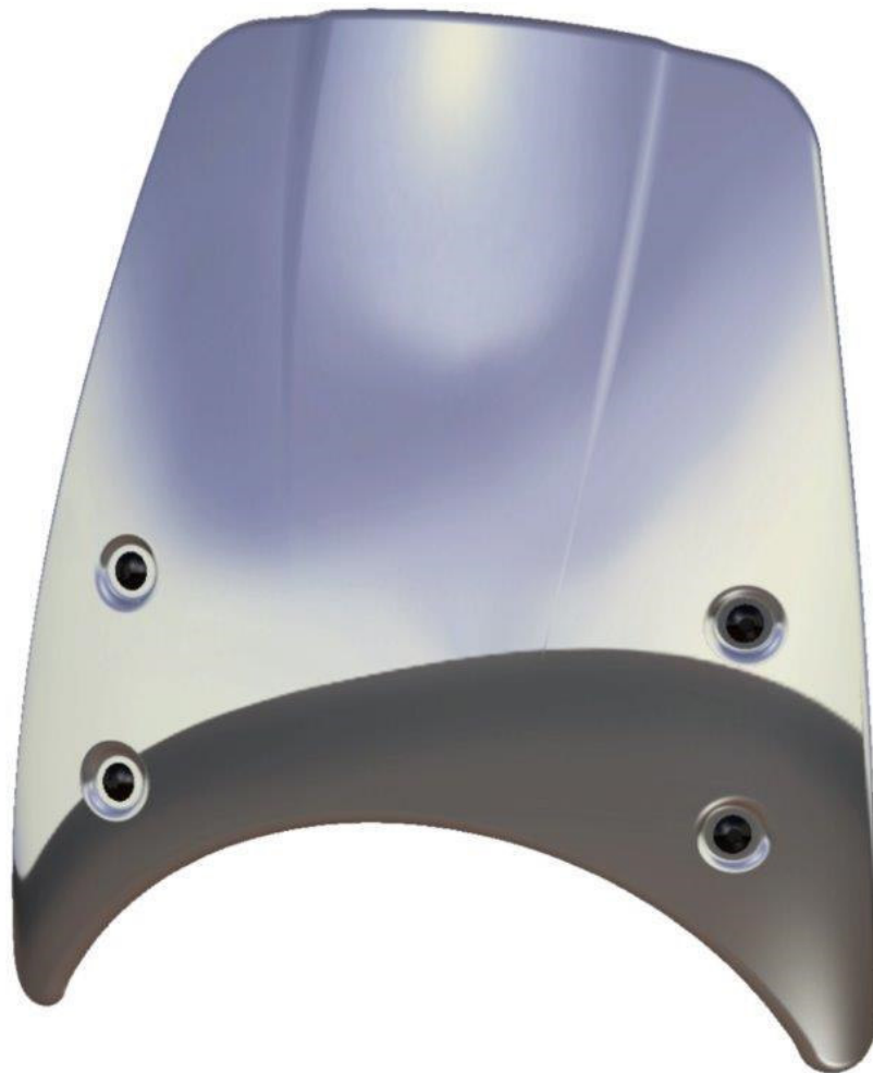
Windschild, Typ CF010