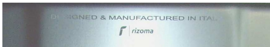
Kennzeichnung oben mittig