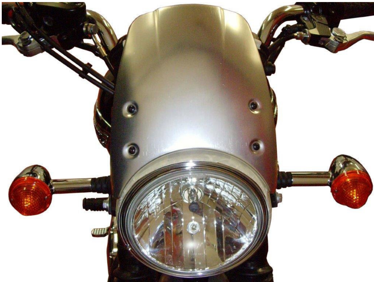
Windschild, Typ CF010