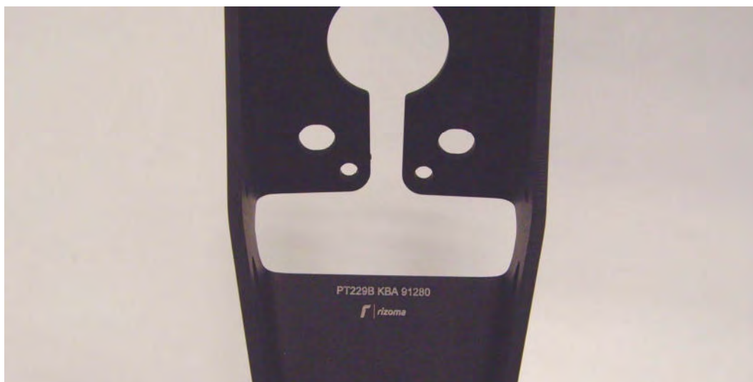
Kennzeichnung, Beispiel Herstellerlogo rizoma, Typ PT, Ausführung 228, Farbcode B (schwarz), Typzeichen KBA 91280