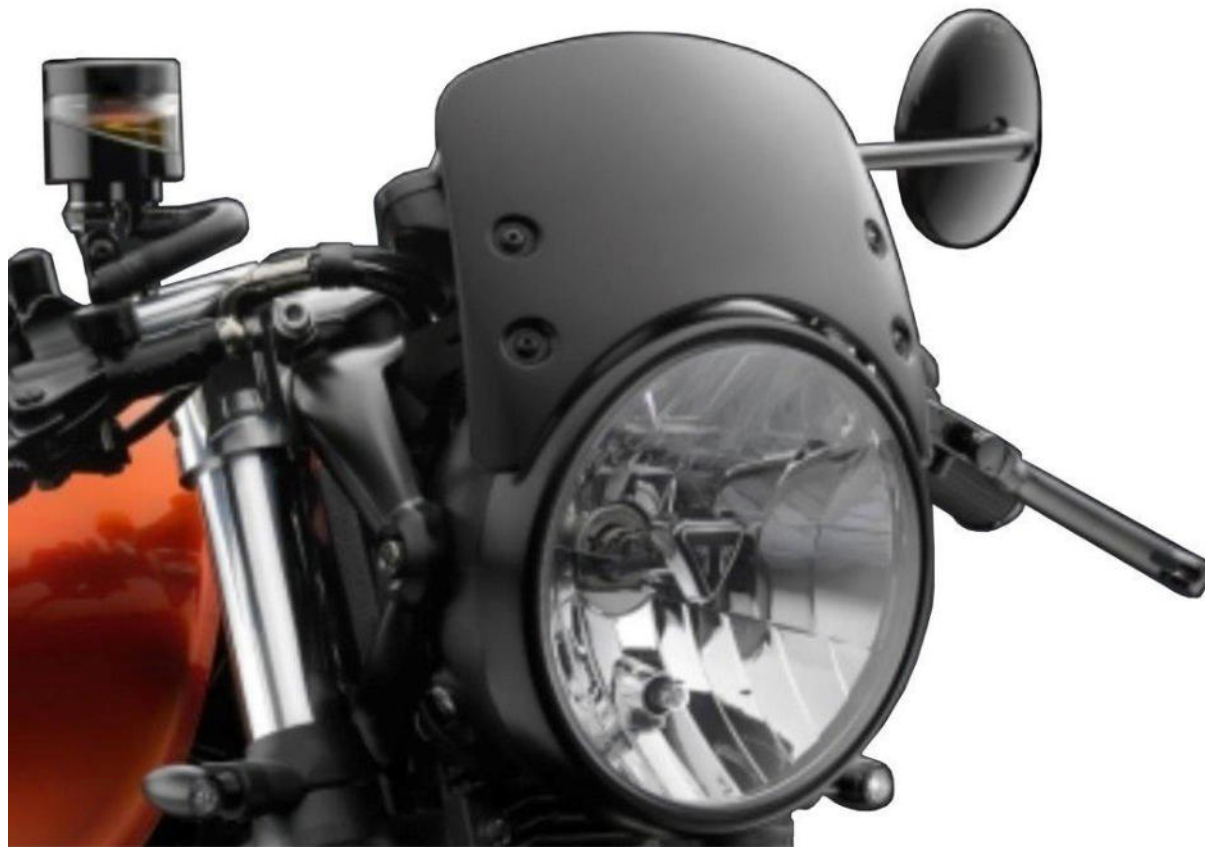
Windschild, Typ CF011