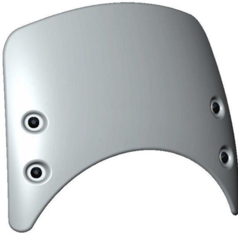
Windschild, Typ CF011