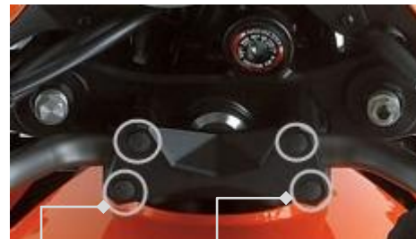
Foto 2 Schrauben die entfernt und ersetzt werden