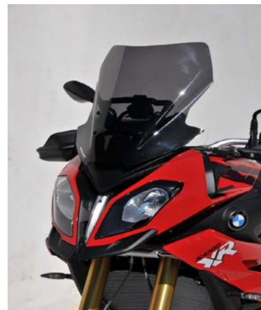
BMW S 1000 XR 2015-