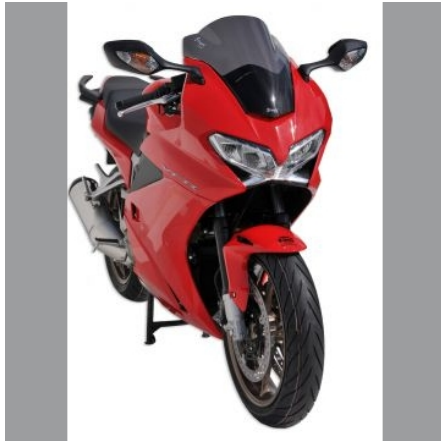
Honda VFR 800 F 2014