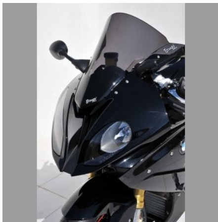
BMW S 1000 RR 2015-