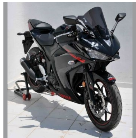
Yamaha YZF-R 25/ R 3 2015-