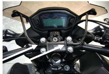
Foto 2 Schrauben die entfernt und ersetzt werden