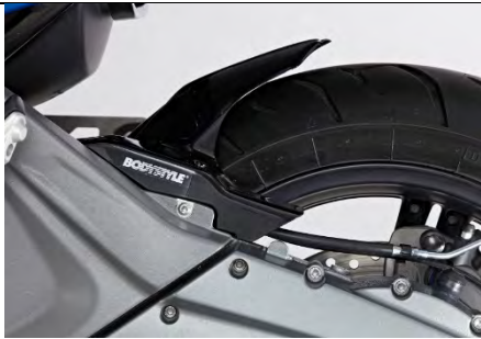
BMW C650 Sport