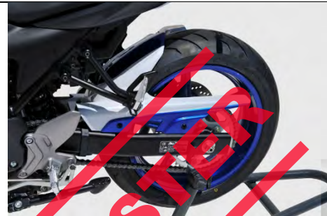
Suzuki SV 650/A