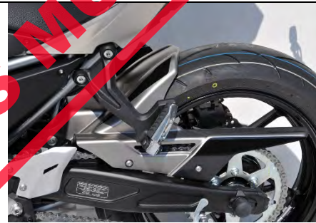
Kawasaki Z 650/Ninja 650