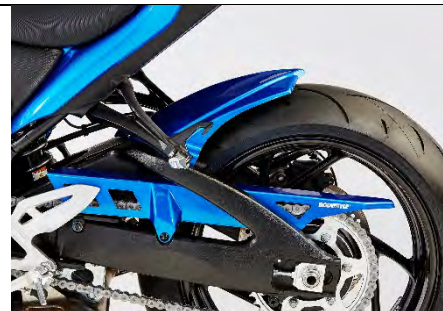
Suzuki GSX-S 750