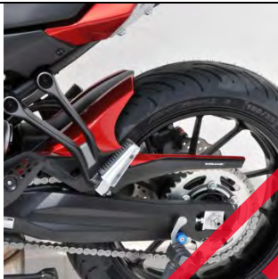
Yamaha MT-07 Tracer