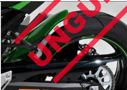
Kawasaki Z 900