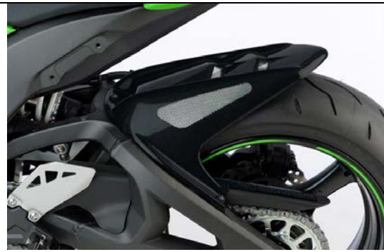
Kawasaki Ninja ZX-10R 2016-