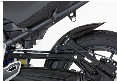
Triumph Tiger 1200 XR/XC 2016-