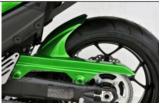
Kawasaki ZZR 1400 2015-