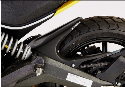
Ducati Scrambler 2015-