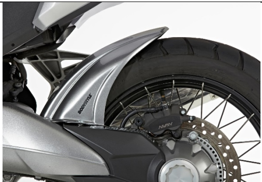
Honda VFR 1200 X Crosstourer 2016-