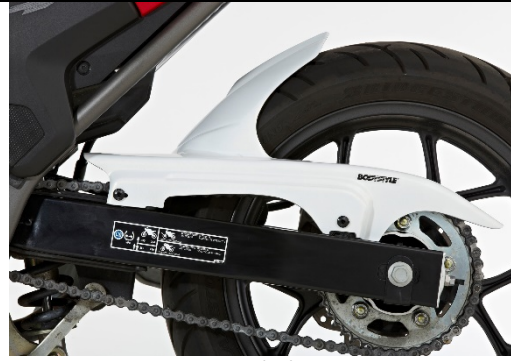
Honda NC 750S/X/Integra 2016-