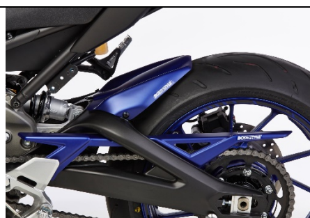
Yamaha MT-09/XSR 900