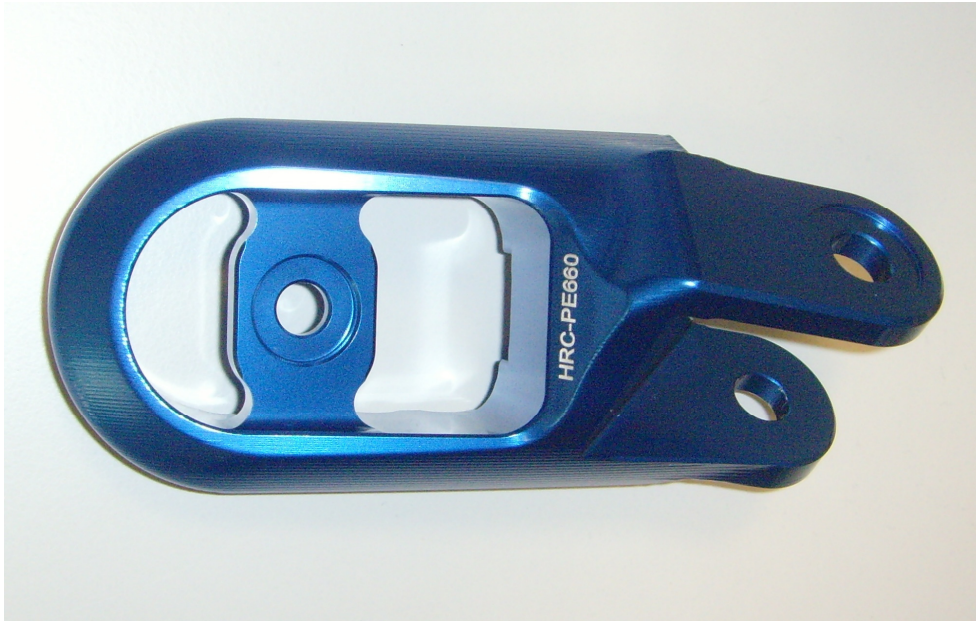
Austauschraste, Ausführung HRC PE660