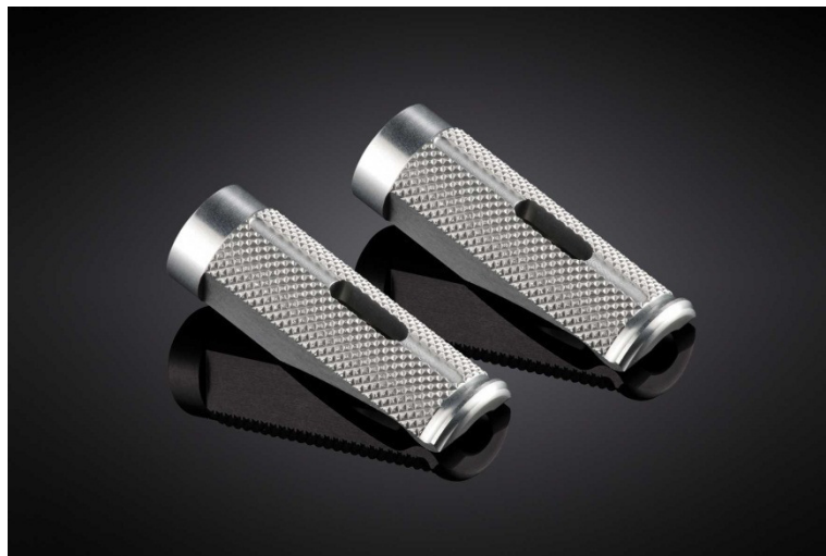
Austauschraste, Ausführung PE614