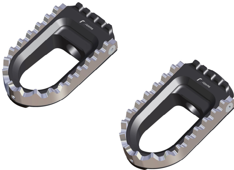
Austauschraste, Ausführung PE640