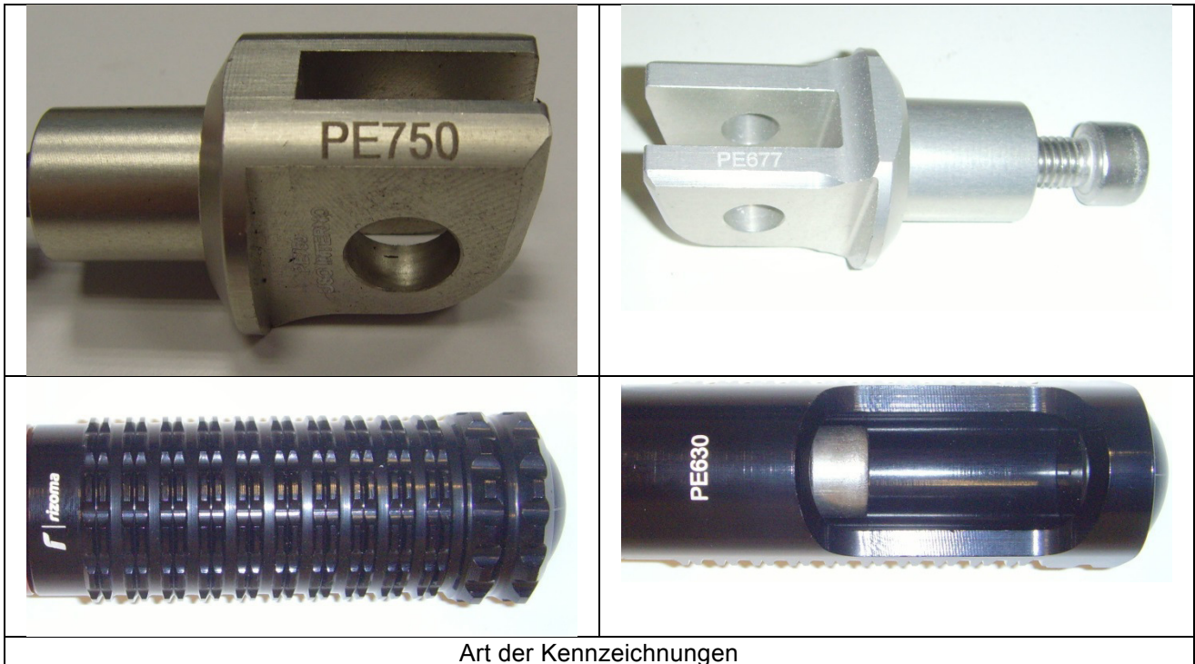
Art der Kennzeichnungen