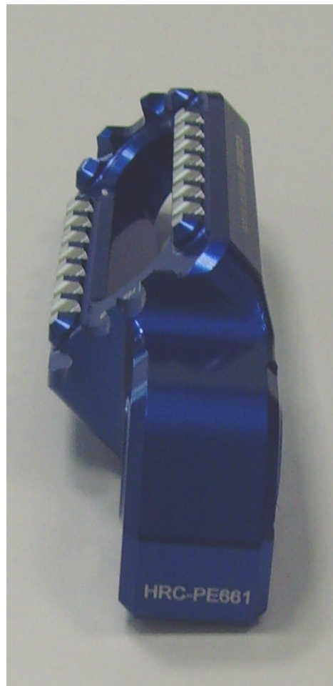
Austauschraste, Ausführung HRC PE661