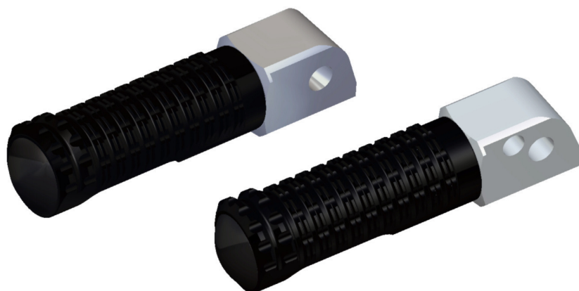
Austauschraste, Ausführung PE127