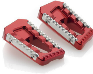
Austauschraste, Ausführung PE622