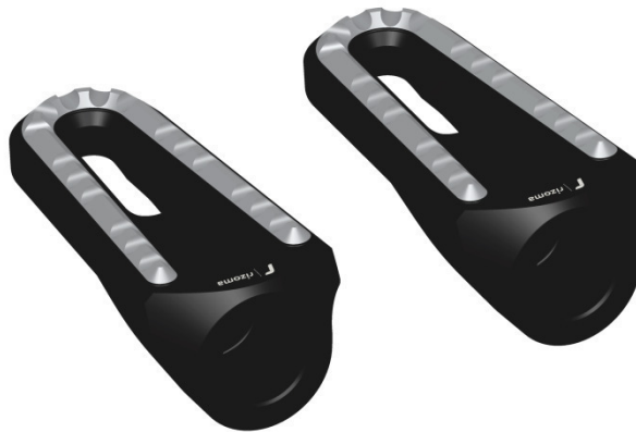
Austauschraste, Ausführung PE642