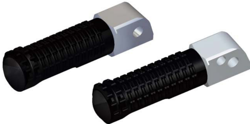
Austauschraste, Ausführung PE127