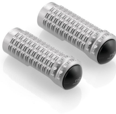
Austauschraste, Ausführung PE630