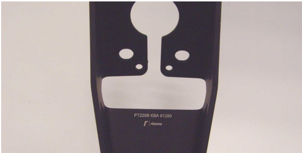
Kennzeichnung, Beispiel Herstellerlogo rizoma, Typ PT, Ausführung 228, Farbcode B (schwarz), Typzeichen KBA 91280