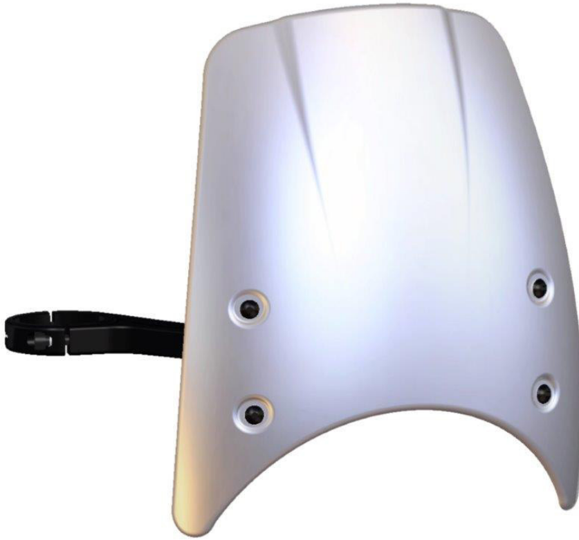
Windschild, Typ ZBW081