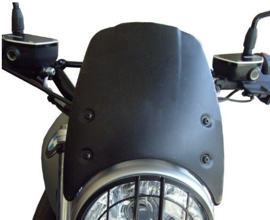
Windschild, Typ ZBW081