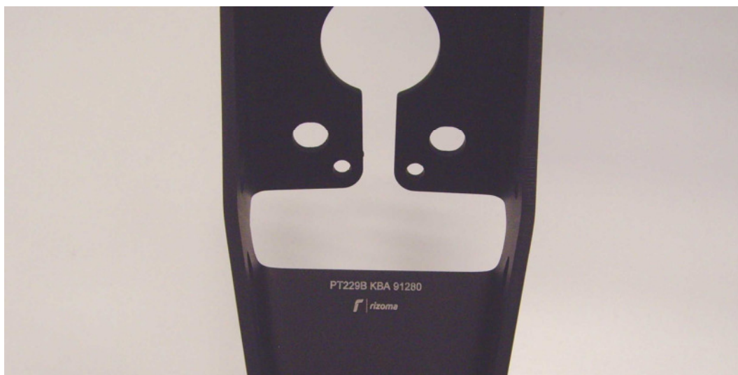
Kennzeichnung, Beispiel Herstellerlogo rizoma, Typ PT, Ausführung 228, Farbcode B (schwarz), Typzeichen KBA 91280